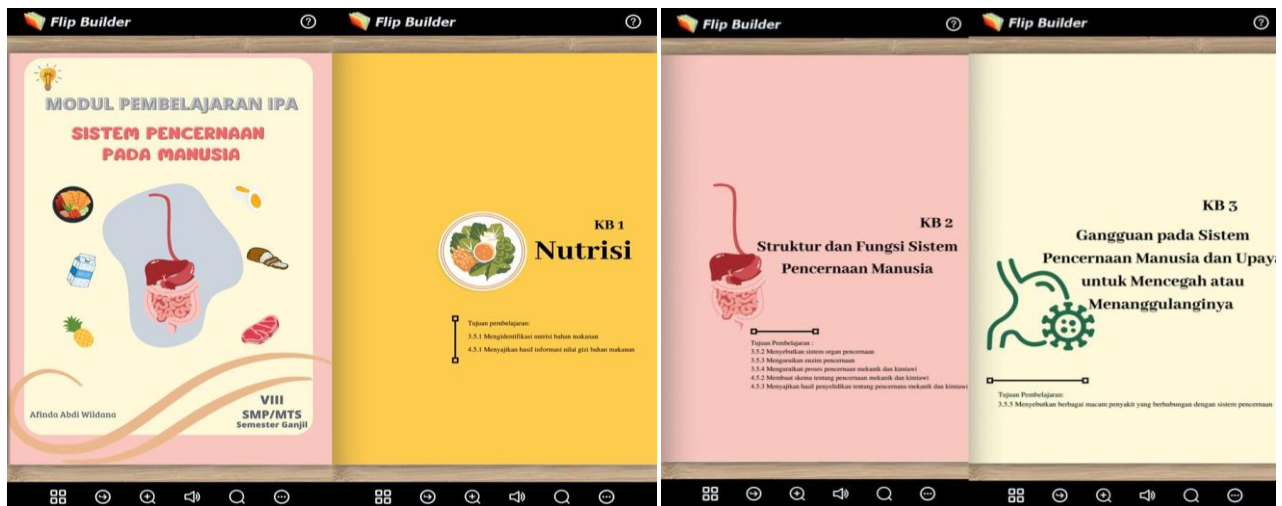
Gambar 1. Tampilan materi pada modul

Tahapan kedua adalah tahap perancangan ( design ). Pada tahap ini peneliti melakukan perancangan produk pengembangan modul berbasis STEM dalam bentuk flipbook digital materi sistem pencernaan manusia agar menghasilkan produk yang valid, praktis, dan efektif. Dalam prosesnya, canva dipilih sebagai aplikasi untuk mendesain modul. Sedangkan perangkat lunak pendukung pengembangan untuk mengubah modul menjadi flipbook digital adalah Flip Pdf Corporate . Dengan menggunakan software ini modul yang telah dirancang akan difungsikan secara digital atau virtual ketika membuka halaman.